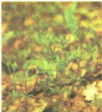
118. Маренка рожева.